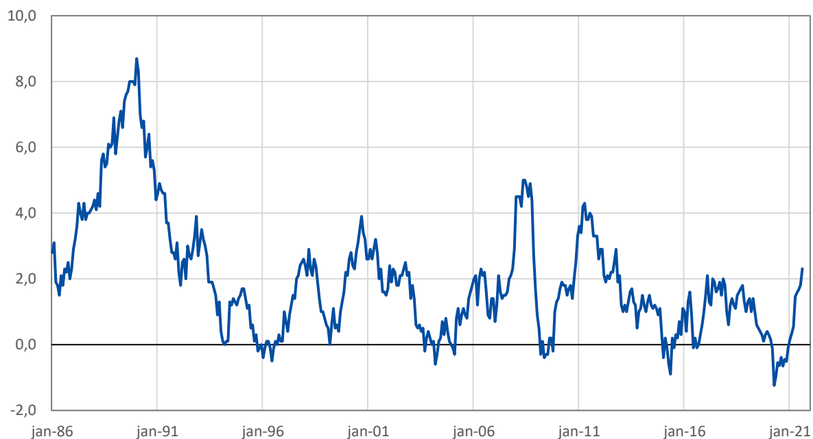
Tabell 7. Harmoniserat konsumentprisindex (HIKP), procentuell förändring under tolv månadersperioder