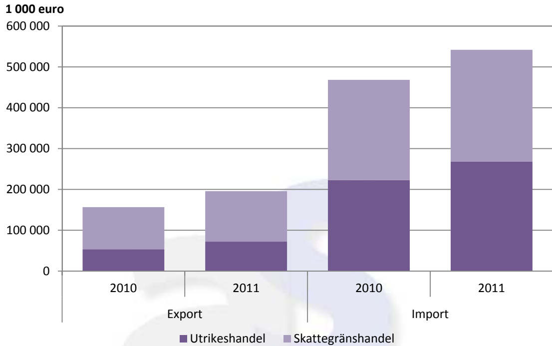
Figur 2: Finlands andel av Ålands varuhandel 2001-2011